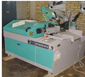
Demo. Automat BS 300/60 AFI-NC