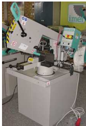
IMET 230 GH, År 2012