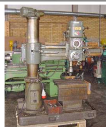
Radialborr Breda Mk4