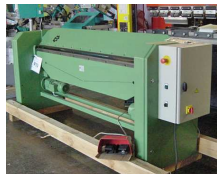
Kantvik HM 2000L