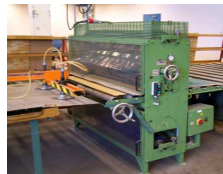
Plätinplastare Woma B1500