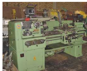
Svarv Weipert WG-425