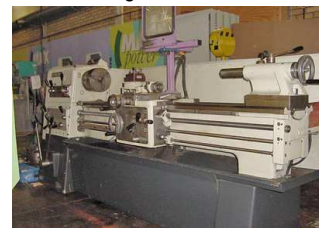
Svarv Storebro GS 210, 210x1600mm