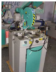
Alukap Velox 350