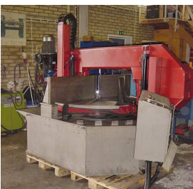
Bianco Mod. 5032-SA-D/S