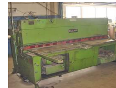
Gradsax Eclair 2550x3,5mm