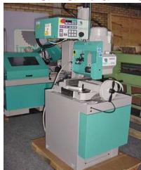
Klingsåg Sirio 370 SH-E

Vi har alltid massor med Nya, Demo och Begagnade sågar på lager.