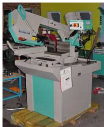
IMET GBS 270 GH