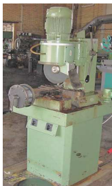
Beg. Klingkap Conni