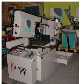
Bandsåg IMET KS-450