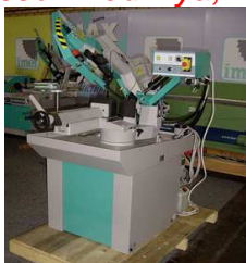
IMET BS 300/60 SHI, Ny