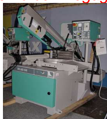
Ny IMET BS 300 Plus SHI