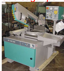
IMET BS 350 SHI