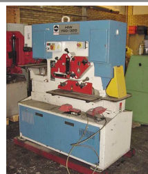
Mubea HIW 750/320