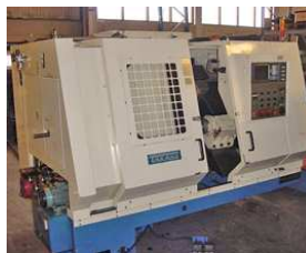
Takang 200ST -96, Fanuc 0T