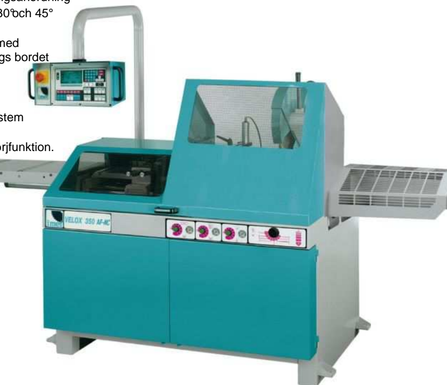
Maskinen på bilden är extrautrustad

Rätten till ändringar i pris och tekniska data förbehålles.